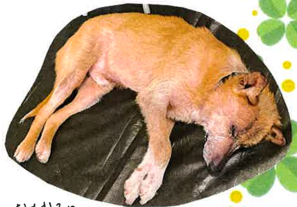
おもむろに 床で寝始めるのバカめ...です。